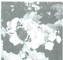
Amateur de jardins ...

L'équipe prépare activement le programme 2008 et nous annonce que de nouveaux jardins seront bientôt accessibles. Vous serez avertis en temps opportun.